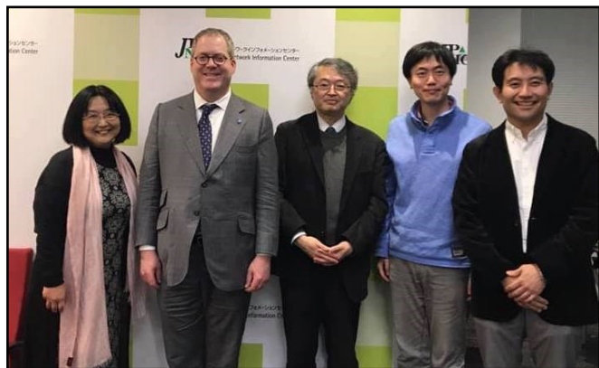
写真：ISOC CEOとISOC-JP Officer